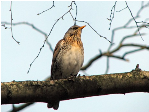
Här är mamma snöskata