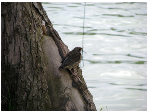
Ibland måste hon vila.