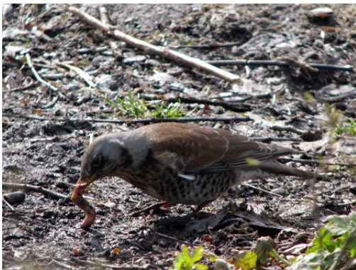
Pappa snöskata hämtar fler maskar, som han kan ge till sina ungar.