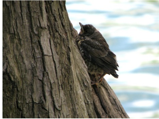
Det var bara att fortsätta uppåt.