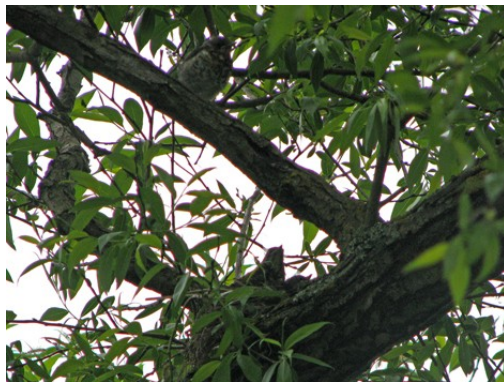
Och ungarna växte och växte.

En dag – det var faktiskt igår – tyckte storebror att han blivit så stor och stark att han nu skulle kunna flyga själv. Han kastade sig ut ur boet och flaxade med vingarna som han sett mamma och pappa göra. Oj, vad jobbigt det var. Han hade ju inte den långa stjärten, som hjälpte mamma och pappa att styra. Men han kom i alla fall ända fram till gräsmattan, där pappa hämtat sina maskar. Och när han fått vila där en stund kunde han flyga vidare, först