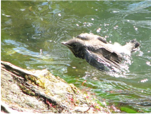
Hon kom iland vid trädet igen.