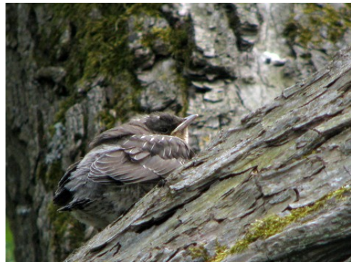
Hon provade att klättra åt höger. Och se! Det gick bra.

Lite högre upp delade sig trädet. Här kunde lillasyster vila sig lite till. Men hon kunde fortfarande inte se boet, så hon visste inte åt vilket håll hon skulle fortsätta.