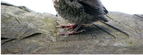
Lillasyster var fortfarande våt efter badet, så hon började frysa.