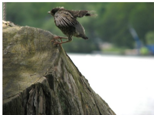
Blev det riktigt brant fick hon hjälpa till med de små vingarna.