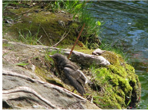
Där skakade hon av sig vattnet så gott det gick.

Sen började hon på nytt att klättra upp i trädet. Men den här gången skulle hon försöka klättra ända upp.