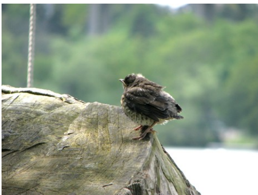
Och så äntligen var hon uppe på en platt bit där hon kunde vila lite längre. Åh, vad skönt det var!