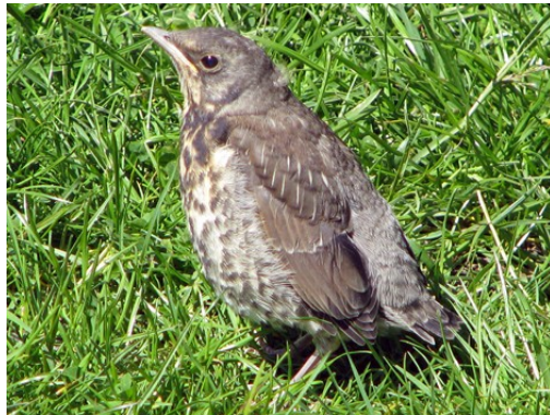
till en buske och sedan tillbaka hem till boet.

En dag – det var faktiskt igår – tyckte storebror att han blivit så stor och stark att han nu skulle kunna flyga själv. Han kastade sig ut ur boet och flaxade med vingarna som han sett mamma och pappa göra. Oj, vad jobbigt det var. Han hade ju inte den långa stjärten, som hjälpte mamma och pappa att styra. Men han kom i alla fall ända fram till gräsmattan, där pappa hämtat sina maskar. Och när han fått vila där en stund kunde han flyga vidare, först