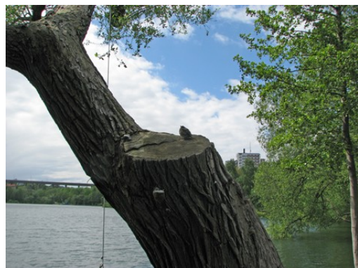
Hon hade nu kommit ganska högt upp i trädet. Men det var fortfarande en bit kvar.