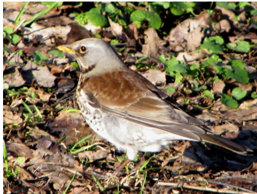
Här är pappa snöskata

De hade byggt ett bo i ett träd invid sjön. I det boet hade de lagt två ägg som nu hade kläckts. Här i boet ser ni nu storebror och lillasyster, som får mat av mamma.